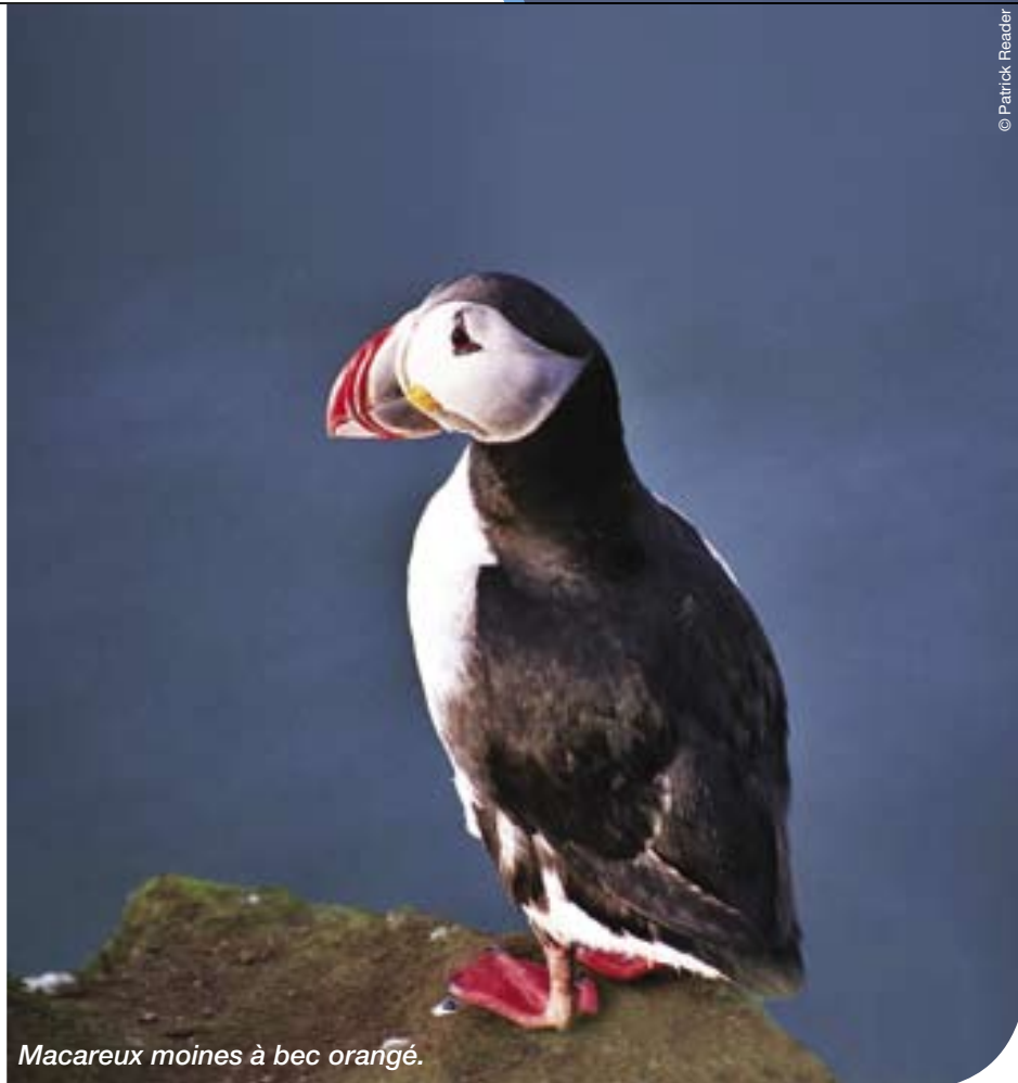
Macareux moines à bec orangé.