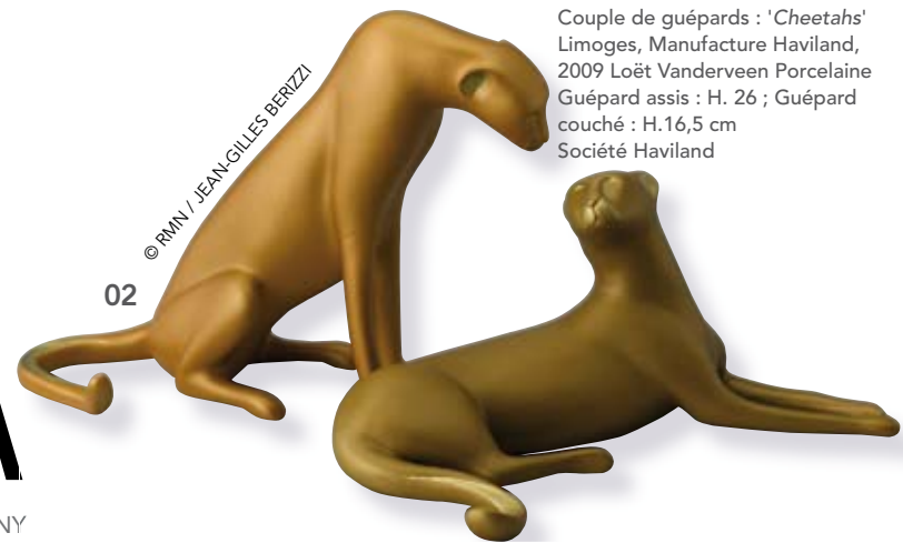
Couple de guépards : 'Cheetahs' Limoges, Manufacture Haviland, 2009 Loët Vanderveen Porcelaine Guépard assis : H. 26 ; Guépard couché : H.16,5 cm Société Haviland