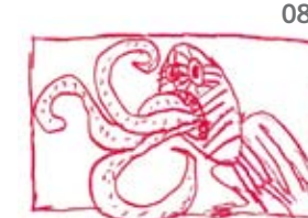
Avoir l'œil pour distinguer le vrai du faux.