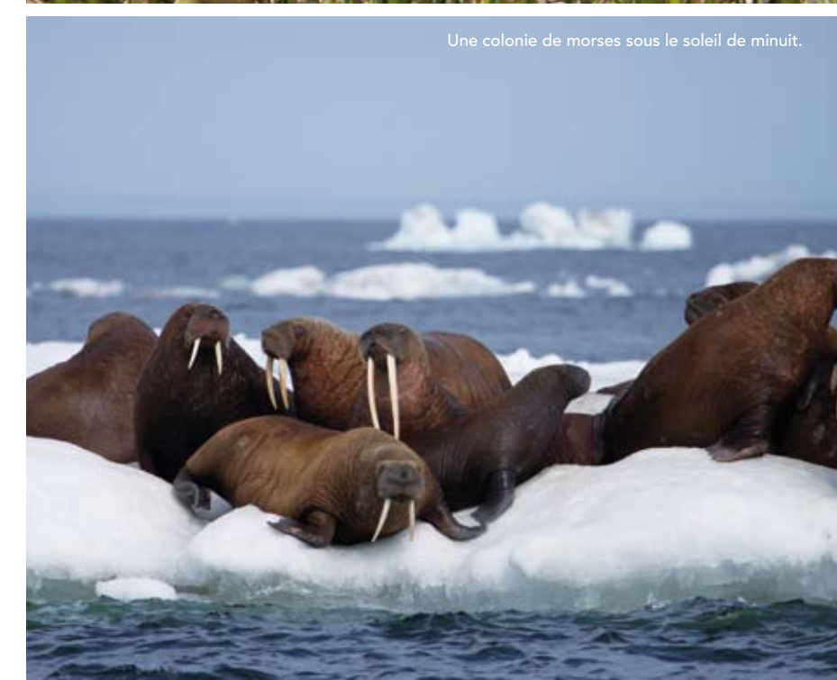
Une colonie de morses sous le soleil de minuit.

nale. L'année dernière, parallèlement à son nouveau challenge, il crée un deuxième projet pédagogique du nom d'Arctic Calling (L'Appel de l'Arctique), afin de partager ses observations via internet tout au long de ce périple. À la fois défi humain et sportif, l'aventure ne s'avère guère évidente. Seule une poignée de voiliers ayant réussi cet exploit à ce jour! Glaces dérivantes, brouillard, vents et courants contraires, changement de profondeur, matériel soumis à rude épreuve: les risques du frontal avec des plaques de glaces isolées et les écueils à éviter sont légion. Nous avons quelquefois été bloqués par la banquise côtière. La patience était de mise. Nous avons parfois dû attendre plusieurs jours que celle-ci se fissure pour trouver des bandes d'eau libre et pour nous frayer un chemin. Nous devons d'ailleurs consulter les prévisions météo quotidiennement et comprendre l'évolution des vents et des zones glacées le long de notre parcours. La vigilance et la concentration étant requises car nul ne savait où les morceaux de glaces isolés pouvaient se trouver. Les risques étaient importants!