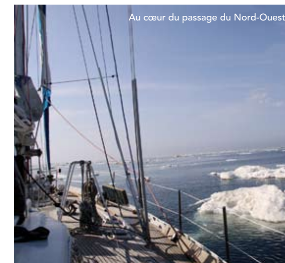
Au cœur du passage du Nord-Ouest.

tir du Pacifique, en parcourant la distance qui sépare l'île alaskienne de St-George en mer de Béring, à Pond Inlet, en Terre de Baffin. Soit quelque 5.000 kilomètres de navigation au cœur de l'océan Arctique. Le dit passage fut franchi pour la première fois d'Est en Ouest en 1906 par l'explorateur norvégien Roald Amundsen. Il faudra attendre le Canadien Henry Larsen pour que l'exploit soit réitéré en 1940-42, dans l'autre sens, à bord du St Roch. En 1977, Willy de Roos fut le premier à traverser en solo le passage à bord d'un ketch de 13 mètres, mais dans le sens Est en Ouest, réputé plus facile grâce aux vents portants. Pour Patrick, la passion pour l'Arctique le prend en 2003. Débutent alors une série de voyages vers ces contrées de l'extrême et la mise sur pied d'un projet éducatif et de sensibilisation concrétisé en 2005 sur le site www.arctic05.org , devenu aujourd'hui une Organisation Polaire Internatio-