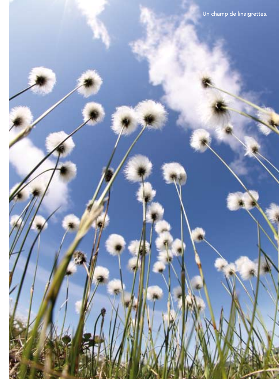
Un champ de linaigrettes.